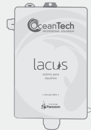
OceanTech Lacus Mini

Produto ecologicamente correto. Não agride o meio ambiente.